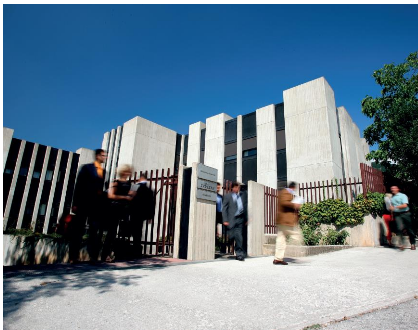
Figura 1 - Direzione Generale Colacem S.p.A. e sede legale di Ragusa Cementi S.p.A. a Gubbio (PG)